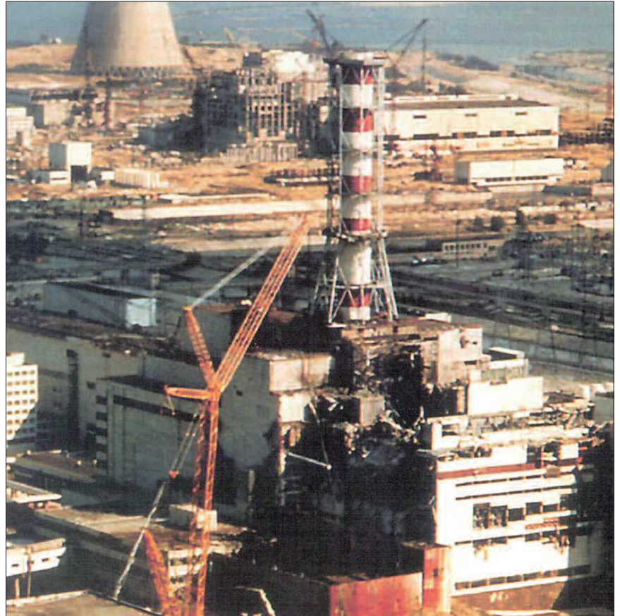
Realisiertes Restrisiko: Der kollabierte Reaktor von Tschernobyl 1986